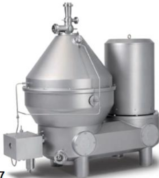
Separador MSE 230-01-777